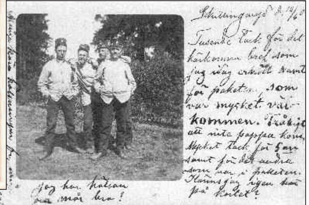
cirka 1904.