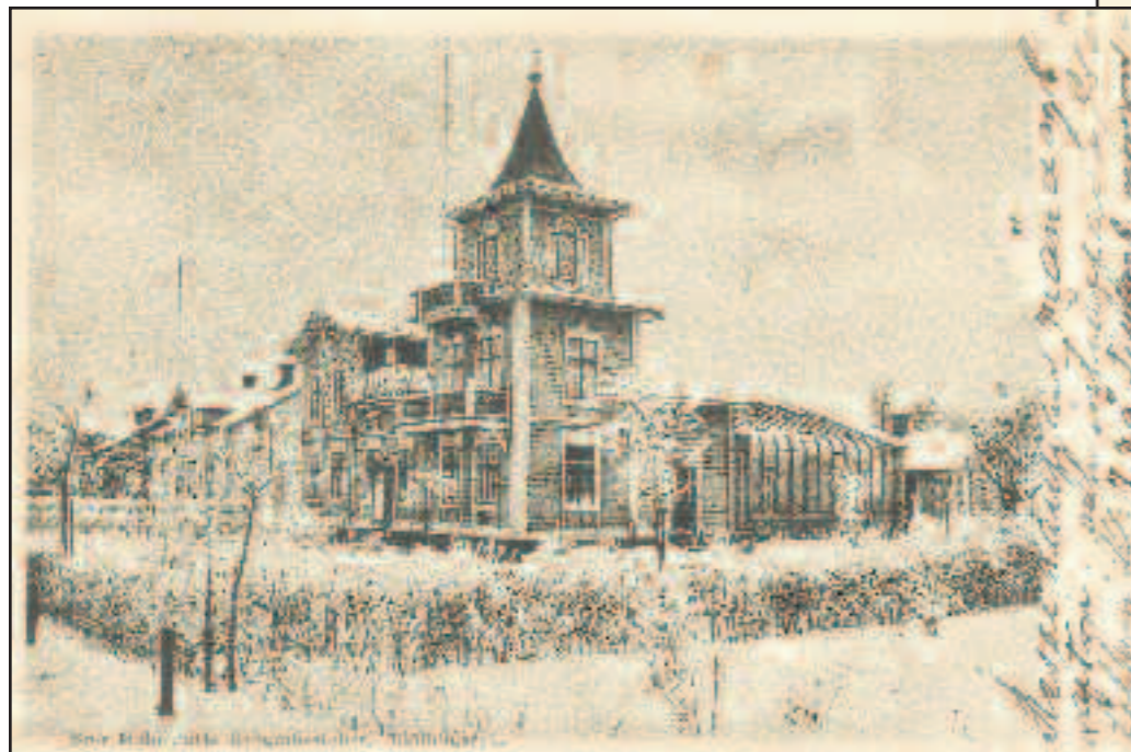
cirka 1900.