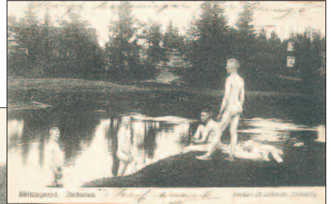
Förlag: M. Izikowitz, Jönköping cirka 1914.

Badorten, det låter något och militären badade ofta här i Lagan nära Åbron.