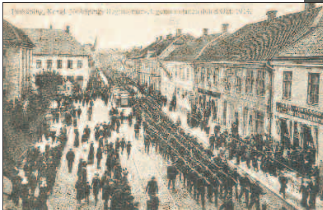
Förlag: Halls Bokhandel. Tryck: Svenska Litografiska AB, Stockholm 1914.

1914 var det mobilisering och påstigning på Slätten. Till höger skimtar stationen och Ljungberghs bostadshus vid Artillerigatan.