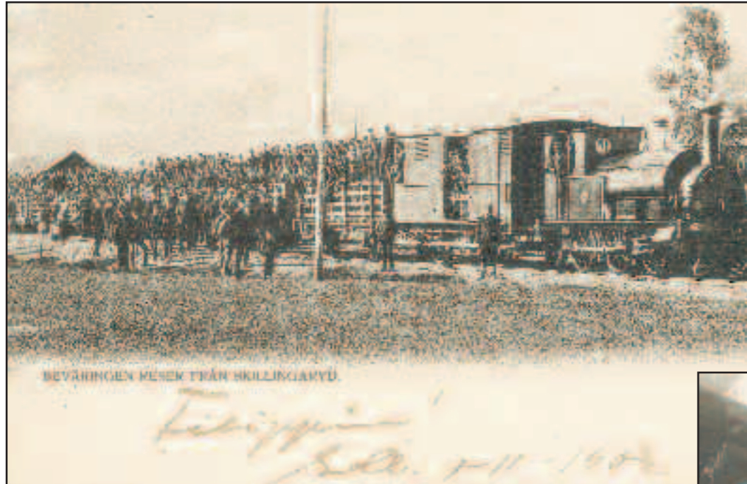
cirka 1890.

När järnvägen kom till Skillingaryd 1879 blev det ett transportmedel även för beväringarna. Det var med tåg man kom till Skillingaryd och med tåg man lämnade. Det var möten och avsked på många sätt. Men en och annan gång lämnade militären för närmast alltid som när regementet marscherade till Jönköping 1914 och när skjutskolan flyttade till Villingsberg 1948.