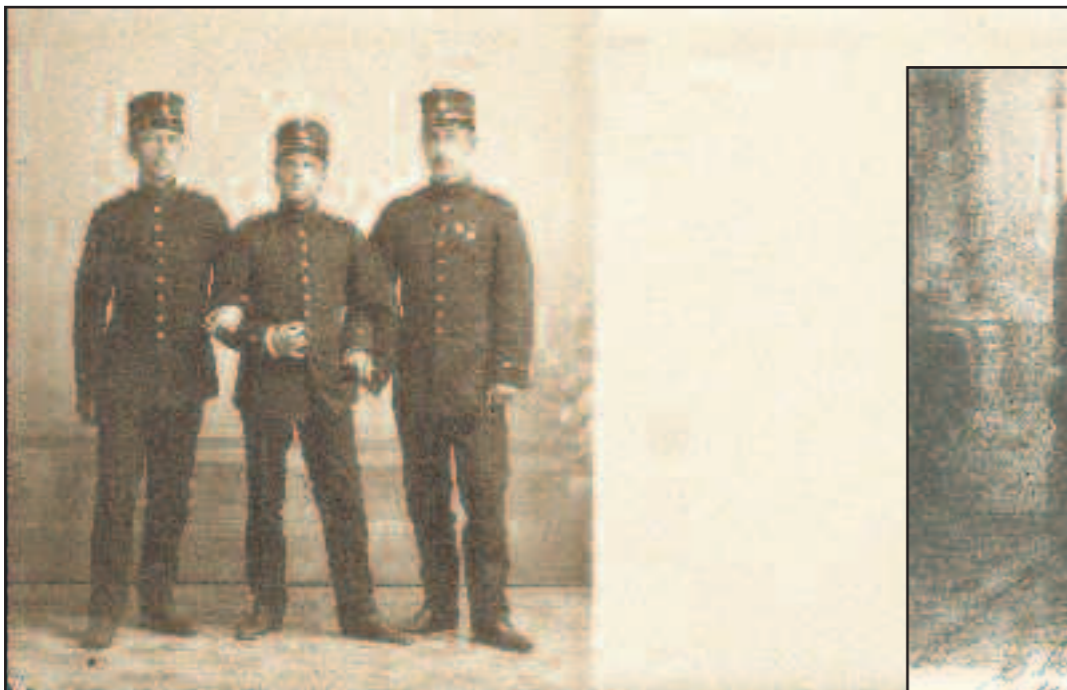
cirka 1910.