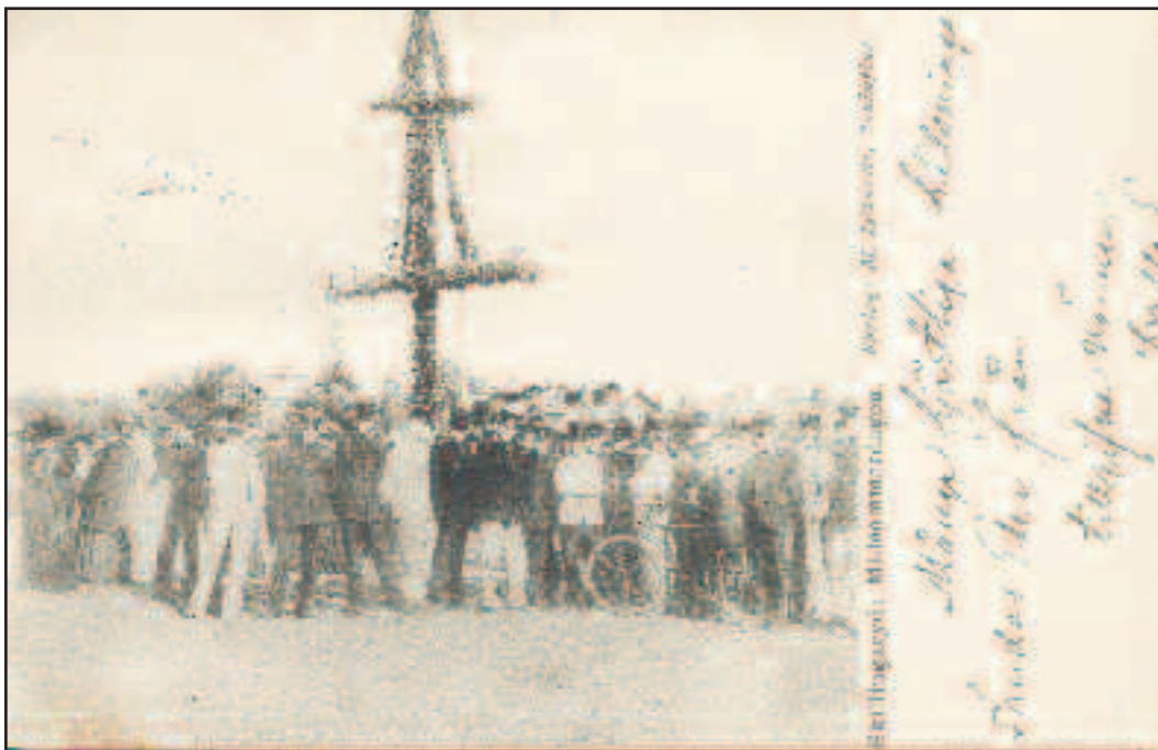
Förlag: M. Izikowitz, Jönköping cirka 1905.

Midsommarfirande på Slätten nära byggnaderna på Västra Lägret. En del civilpersoner ses också på bilden.