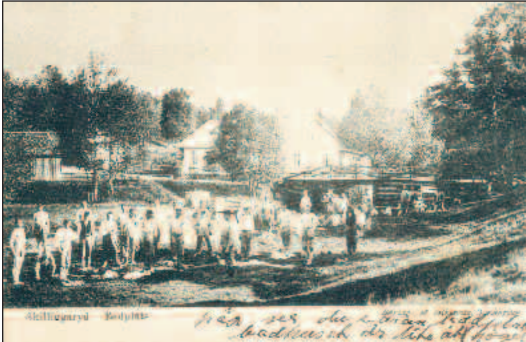
Förlag: M. Izikowitz, Jönköping cirka 1910.

I. 2. Militärer och befolkningen möts Det har alltid förekommit möten militärer-skillingarydsbor emellan. I Skillingaryd har många fått utkomst tack vare militären och en och annan kvinna från orten gifte sig också med en militär.