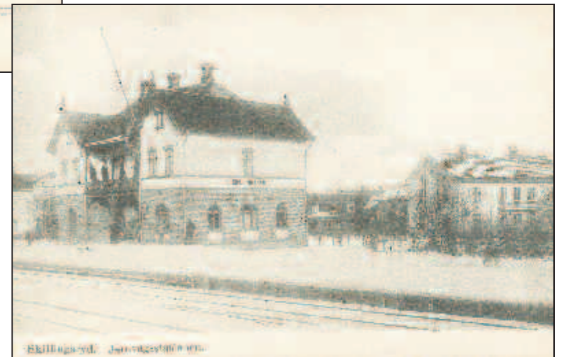
cirka 1900.