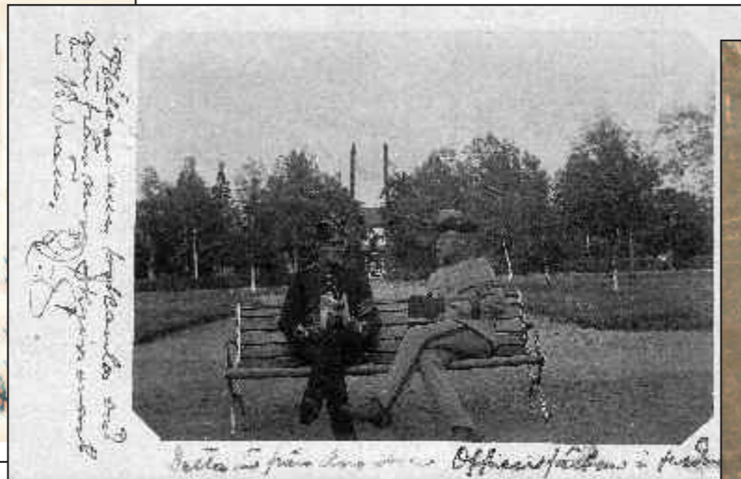
Foto: Okänd framför mässen på Västra Lägrät cirka 1907.