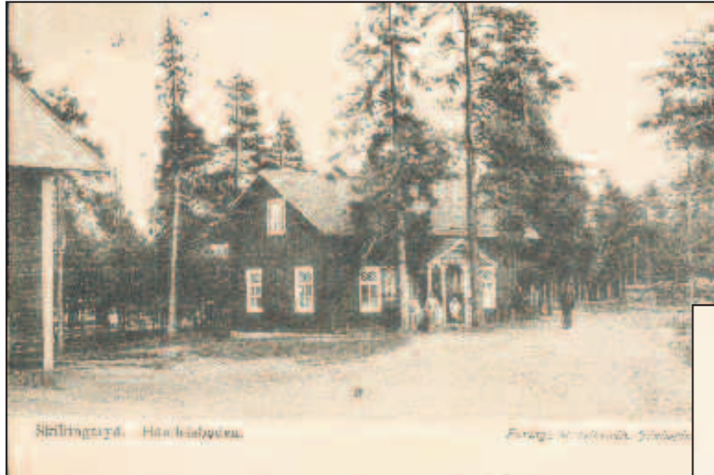
cirka 1900.