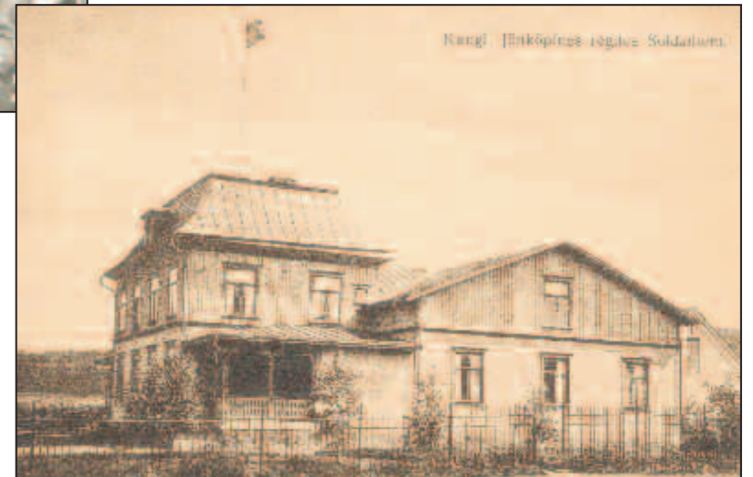
cirka 1915.

Med sig från Skillingaryd tog man bokstavligen talat även Soldathemmet och det står än i dag kvar en bit söder om A 6 köpcentrum .