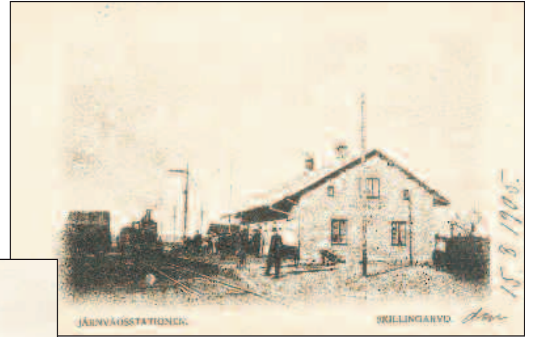
cirka 1905

Det är den gamla stationen som syns, vilken revs och ersattes av en ny station 1907. I stationen hade militären en egen väntsal men det var endast för befälen. Det vanliga manskapet fick blanda sig med alla andra resenärer.