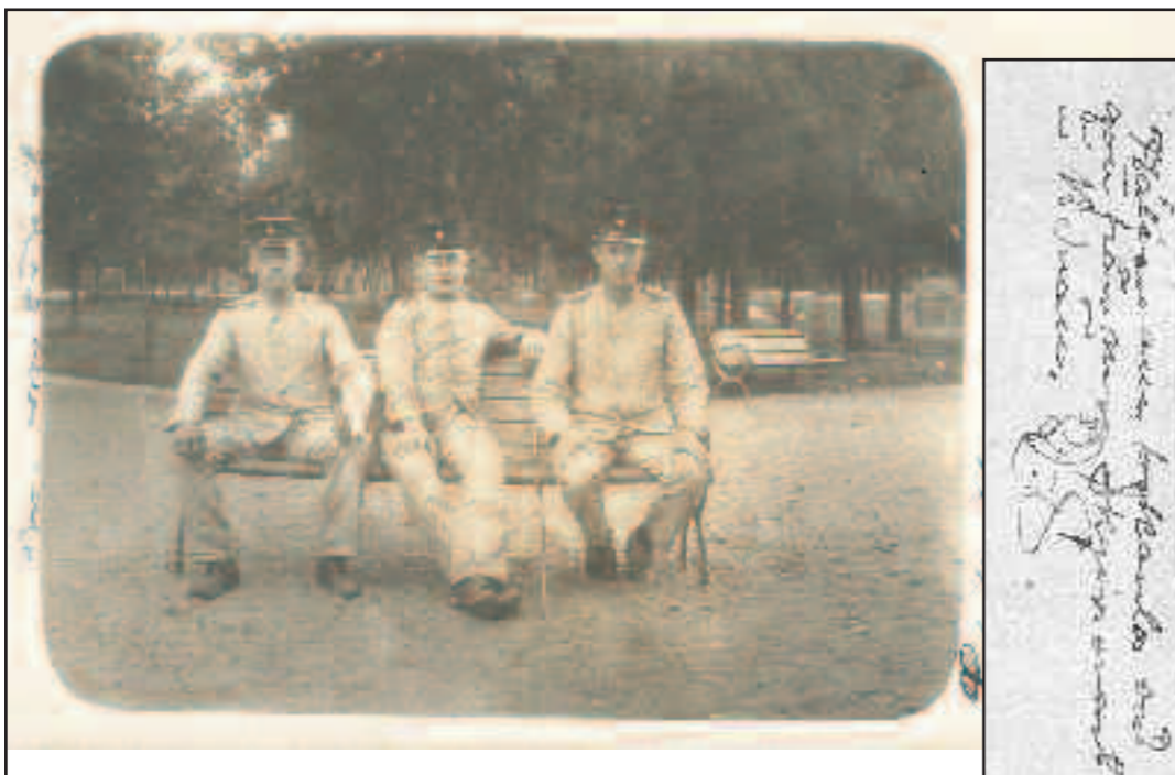
cirka 1907.