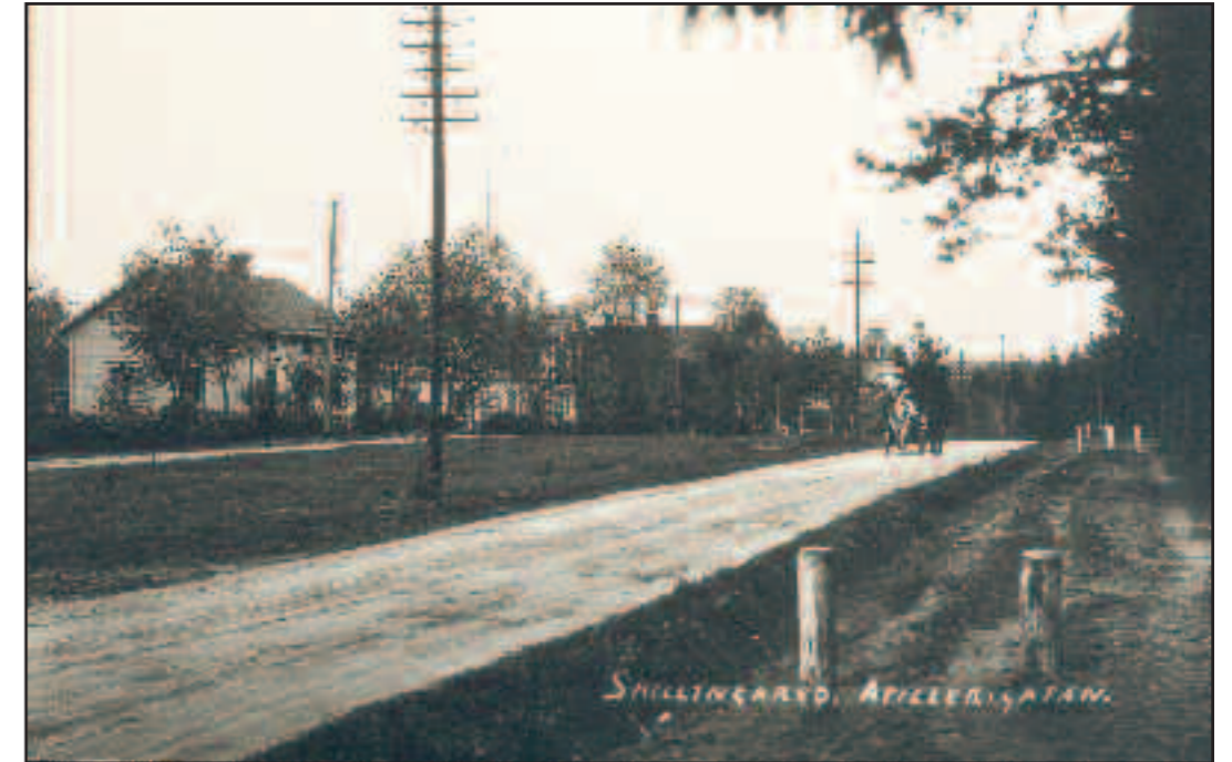
cirka 1920.

Artillerigatan kallades ett tag Tofferydsvägen men numera har den fått namnet Kaffegatan. Det senare har att göra med att det var kaféer i vart och vartannat hus med anledning av alla militärer. I dag har gatan från järnvägen och rakt ut mot Västra Lägret namnet Artillerigatan.