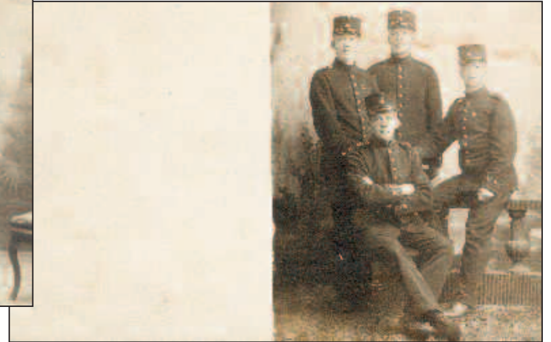
cirka 1906.