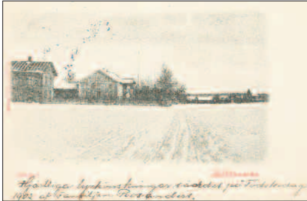
Förlag: Ekegrens Pappershandel cirka 1902.

Militärens prägel på Skillingaryd har bland annat tagit sig uttryck i namn som Artillerigatan, Infanterigatan, Slätten, Heden och Oscar. Sedan finns det ute på skjutfältet mängder av namn med militär anknytning. I Skillingaryds vapen finns till och med två kanoner, vilket understryker militärens betydelse.