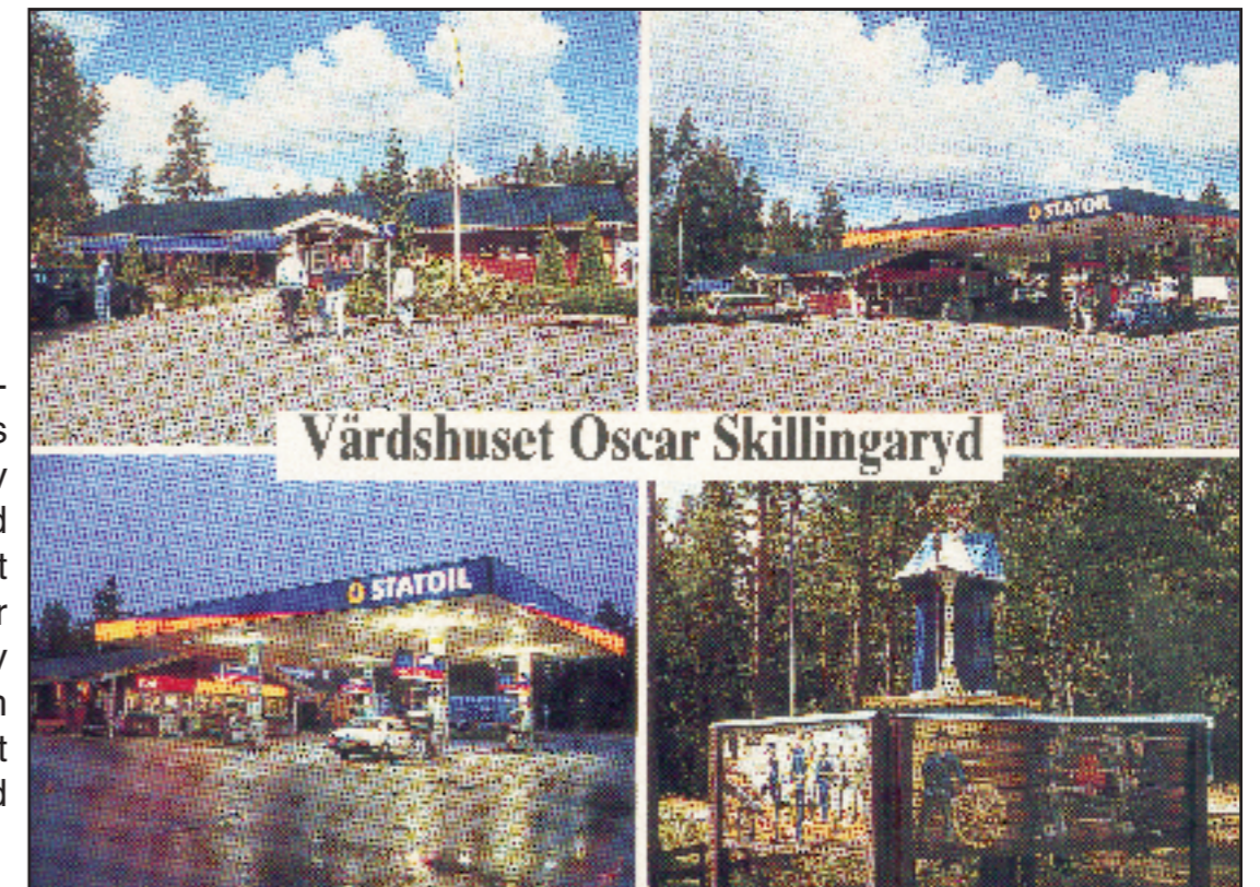
Foto: Olssons Foto, Skillingaryd cirka 1990. Tryck: E. Danielsson, Genevad nr 2009.

Vid Statoil byggdes ett värdshus 1983 och det blev ett namn med anknytning till det militära: Oscar med anledning av kung Oscar II som 1896 hade gästade Skillingaryd