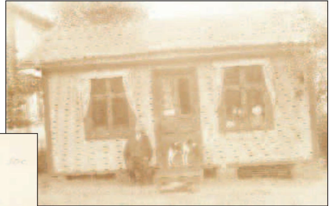
cirka 1920.