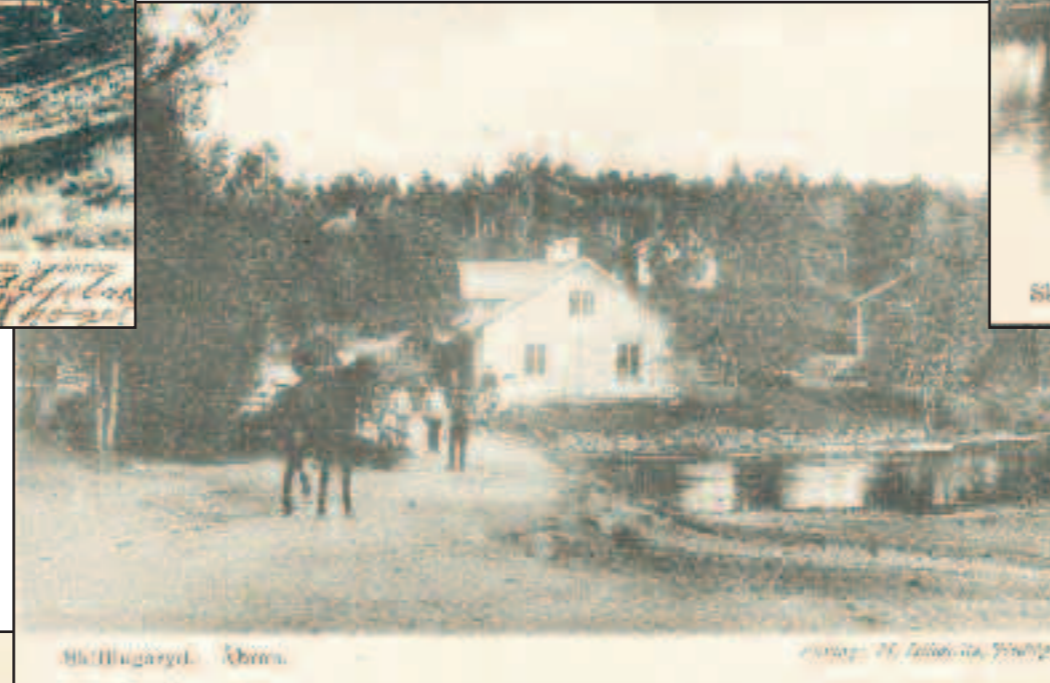
Förlag: M. Izikowitz, Jönköping cirka 1914

En militär och Skillingarydsbor på gränsen till "Brooklyn", alltså bebyggelsen öster om Åbron.