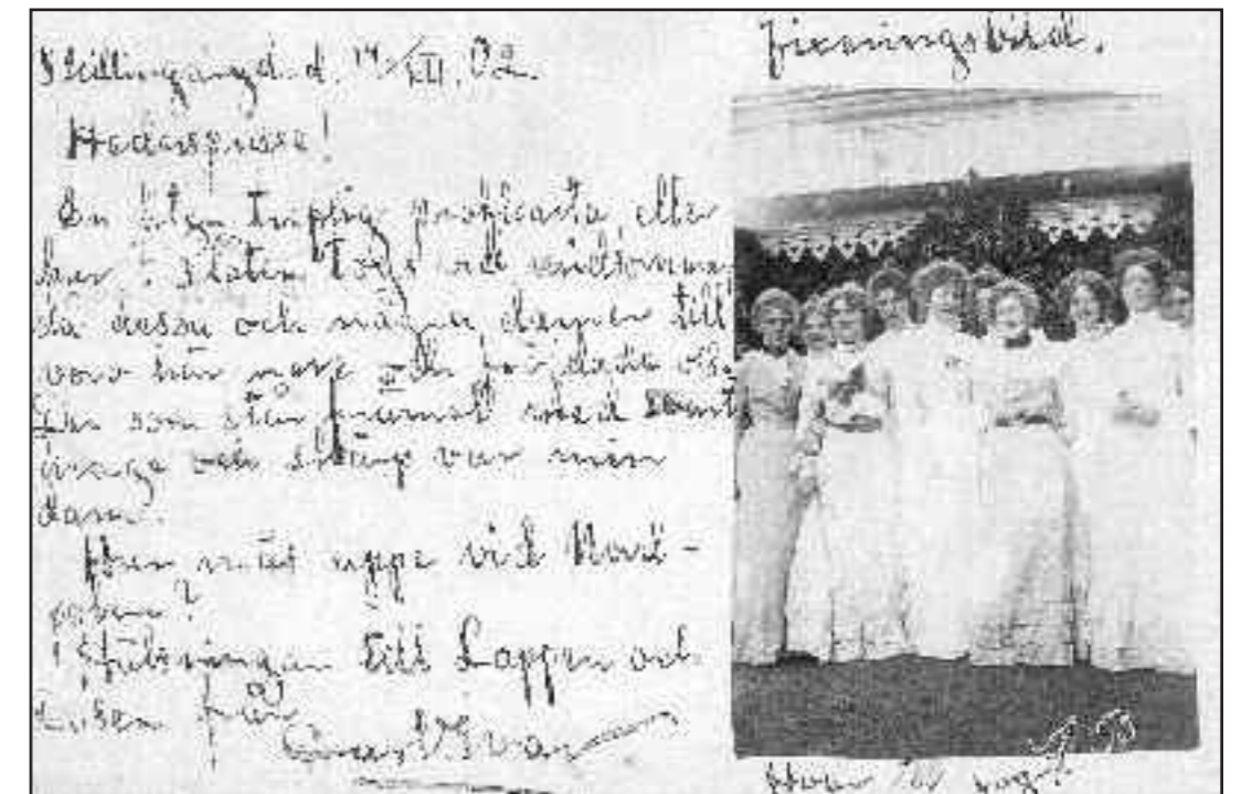
cirka 1902.

Några damer som uppvaktades av militärer midsommar 1902. Bilden är tagen vid mässen på Västra Lägret (hus 146).