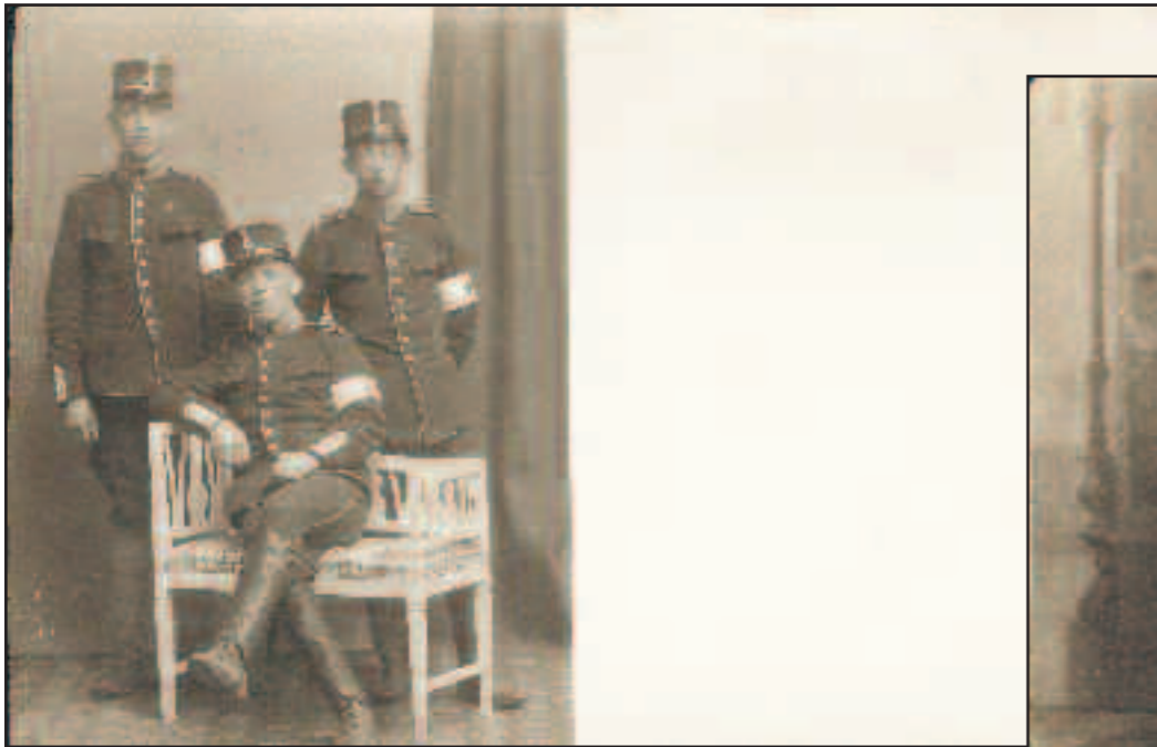
cirka 1911.