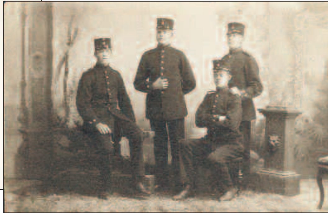
cirka 1907.