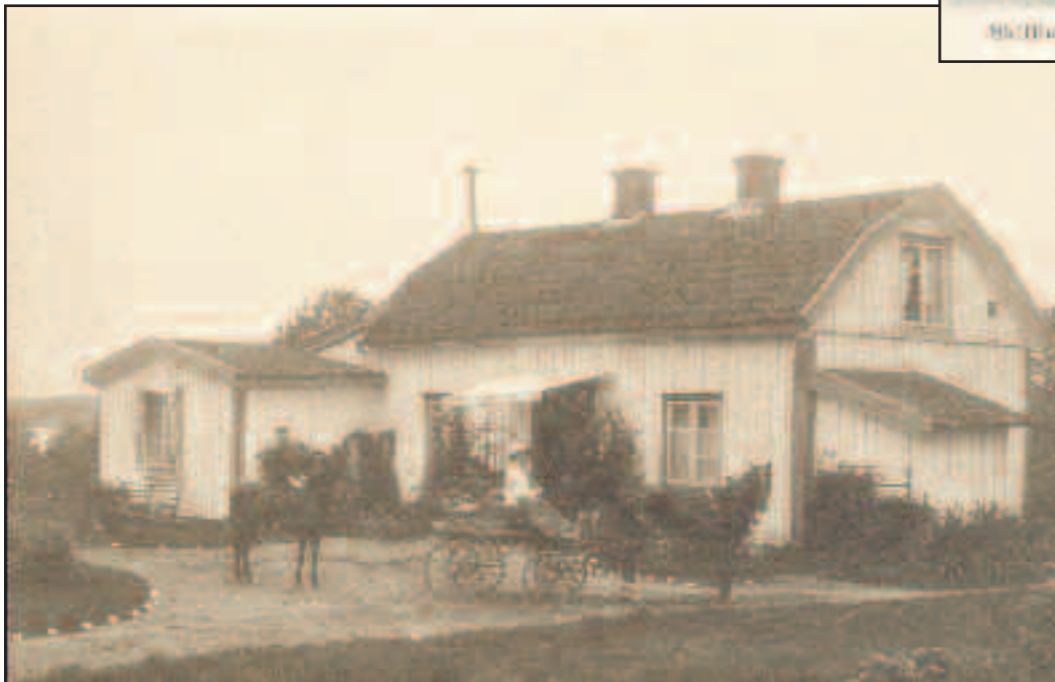
cirka 1910.

En militär och Skillingarydsbor på gränsen till "Brooklyn", alltså bebyggelsen öster om Åbron.