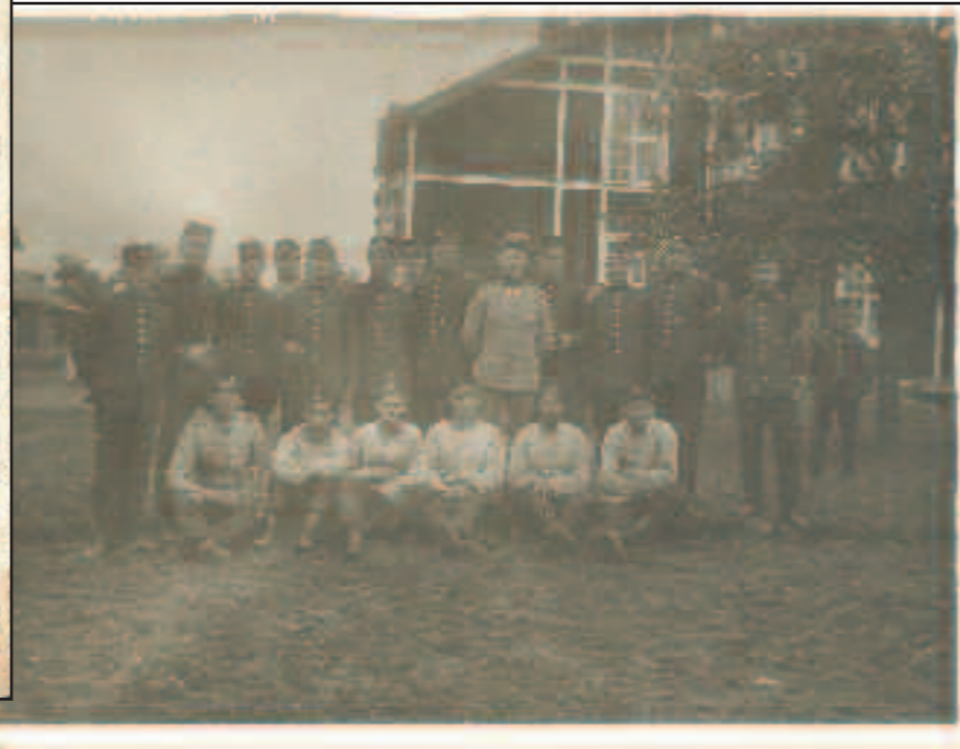
cirka 1910.