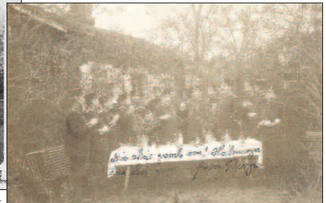
cirka 1903.